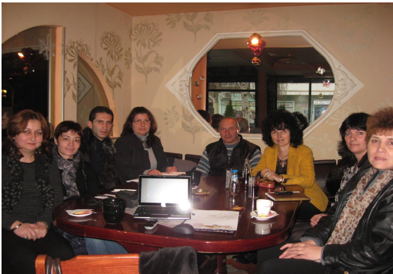
РИПО бюлетин - брой 1